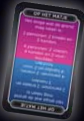
OP HET MATJE