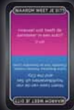
WAAROM WEEET JE DIT?