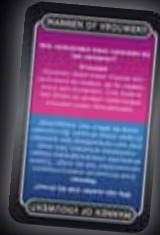
MANNEN OF VROUWEN?