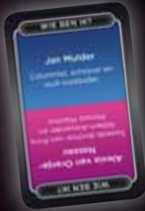
WIE BEN IK?