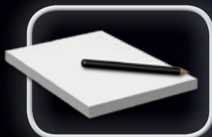
WEL NODIG, MAAR NIET INBEGREPEN